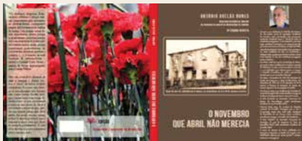
Imagem de capa do livro