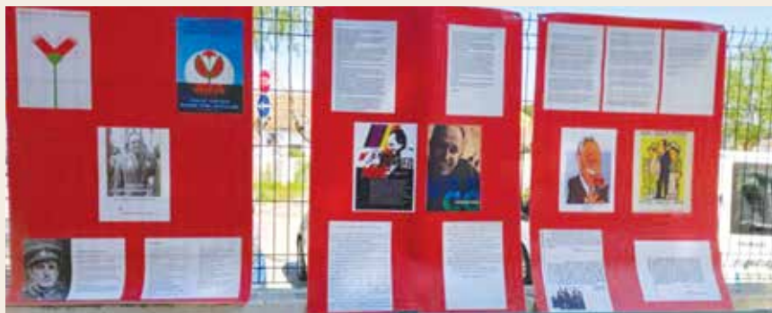
Exposição itinerante (22 de Abril no Bairro Alentejano, Quinta do Anjo)

Liberdade. No dia 2 de abril assinalámos a data da promulgação da Constituição de Abril com uma sessão na Casa do Alentejo e, nessa data e com finalidade idêntica, o nosso núcleo do Porto participou numa iniciativa conjunta com várias organizações. Nos dias, 23 (Lisboa, na Casa do Alentejo) e 24 (no Porto, Seminário Diocesano) teremos jantares de convívio da ACR para assinalar o 25 de Abril de 1974 e a 25 de Abril integraremos o desfile na Avenida da Liberdade em Lisboa. Em todas estas iniciativas esperamos a vossa participação e aos nossos associados que vivem espalhados pelo País apelamos a que participem e integrem as iniciativas locais alusivas à data.